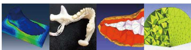
生体力学モデリング