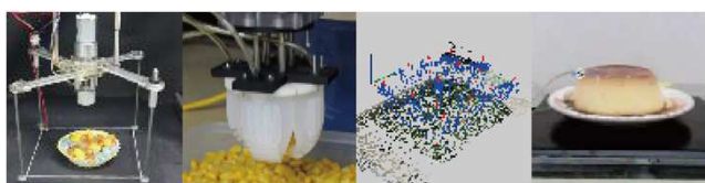
食品マニピュレーション